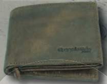
5. Preis: Greenland Nature Geldbörse