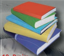
6.-10. Preis: Premium-Buchpaket mit 5 Titeln

Der Lösungssatz, ein Zitat des dritten amerikanischen Präsidenten Thomas Jefferson (1743-1826), der sicher auch auf viele unserer Kundinnen und Kunden zutrifft, lautet: (bitte ggf. auf Bestellkarte, Fax, Mail etc. übertragen oder den Mitarbeiterinnen und Mitarbeitern am Telefon mitteilen)