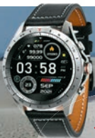
1. Preis: Smartwatch mit Lederarmband