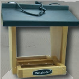
4. Preis: Futterhaus »Markus«